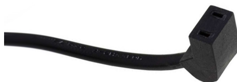
Y008/ST2, угловая вилка 45°

Вентиляторные кабели питания представляют собой сдвоенные провода под общей защитной оболочкой, оконцованные с одной стороны разъемом и подготовленные с другой стороны для пайки или зажима.